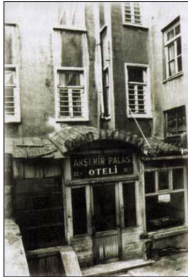
Sirkeci'de bulunan Akşehir Palas Oteli

Siz falan Nasuhizade Şeyhülislamın torunusunuz. Babanız da Nasuhizade müderris falanca, siz bunların evladlarısınız. Onlar, din-i mübine hizmet eden kimselerdi, sizin de öyle olmanız umulur. Bana bu Halk Partisi idaresi, iktidarı boyunca, akla gelmedik eziyetler yaptı. Sürgünden sürgüne, mahkemeden mahkemeye göndermiştir. Risaleleri