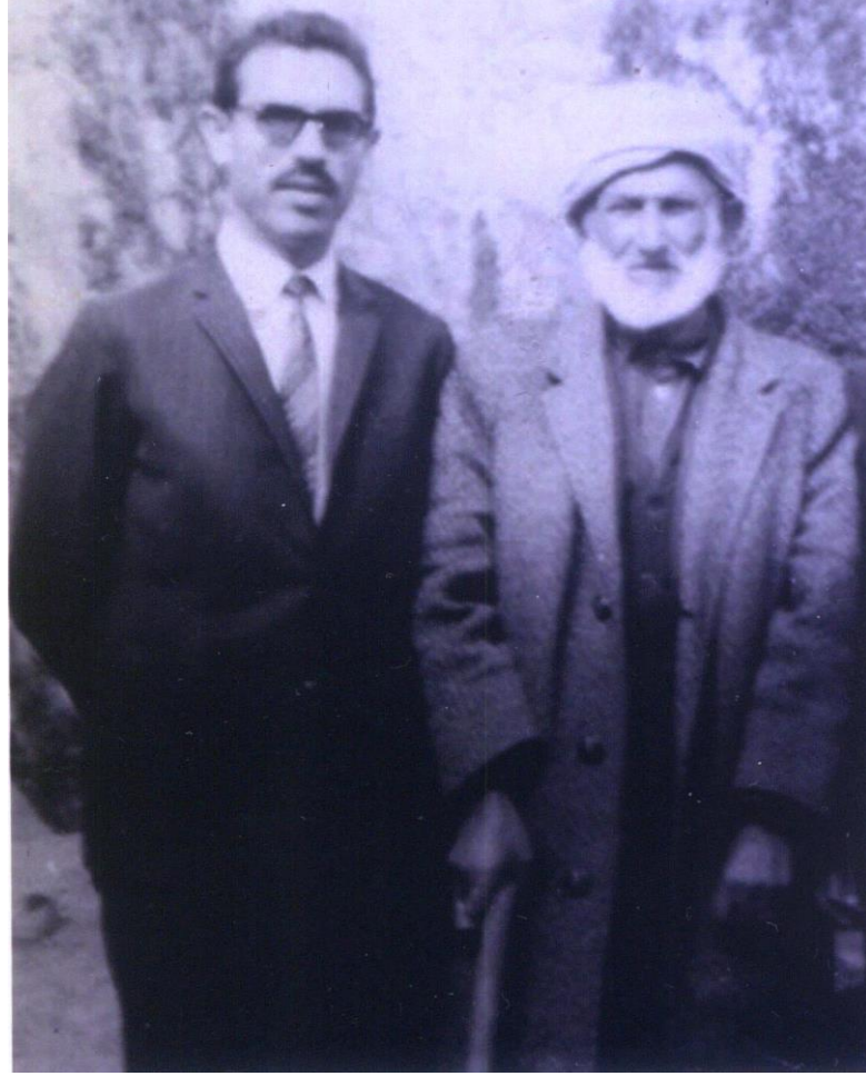
Bediüzzaman Hz. ile Kosturma esir kampında beraber kalmış olan