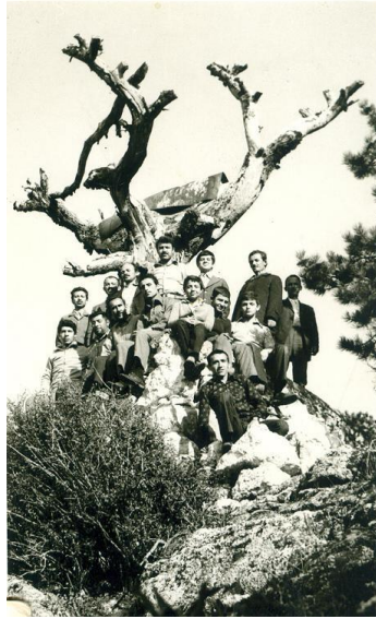
Çamdağı'nda bulunan kuru Katran ağacının tabanına beton dökülmeden evvel