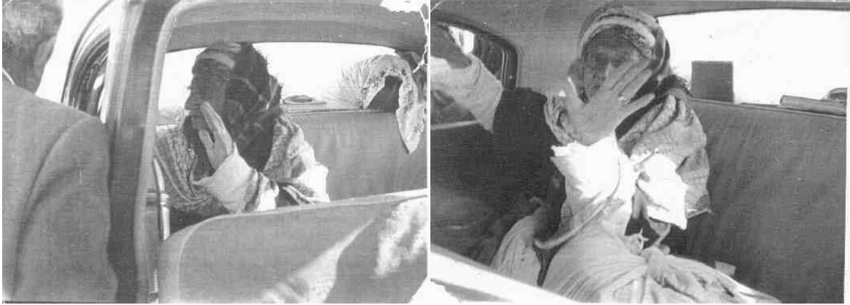
Bediüzzaman Hazretlerinin üst üste çekilen dört kare fotoğrafından ikisi daha.