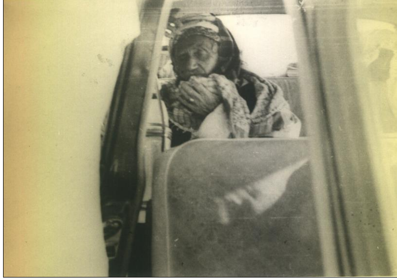
Üstad Bediüzzaman Hazretleri otomobilin içinde huşû içinde dua ederken.