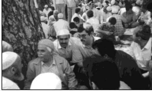
İzmir-Çamlık'ta, yıl 1993...

Üçüncü Mektup'ta: "Şimdi şu 'hunnes-künnes' tabir edilen seyyarelerle şu zeminimizi kâinat fezasında birer gemi, birer tayyare suretinde kemal-i intizamla döndüren ve seyr ü seyahat ettiren Zatın haşmet-i rububiyetini ve şaşaa-i saltanat-ı ulûhiyetini güneş gibi parlaklığıyla gösteriyorlar" cümlesi okunurken, Sungur Ağabey Üstad'tan şu hatırayı nakletti: