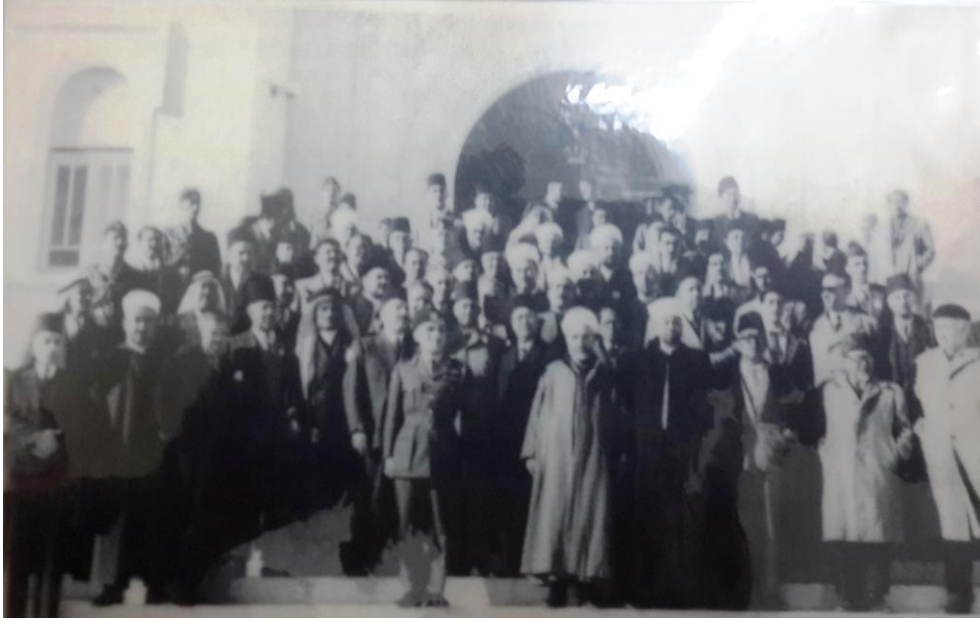
Kudüs 1953. İlk İslam Konferansı'na iştirak eden devlet adamları ve ulema.