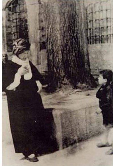
Bediüzzaman Fatih Camii avlusunda bir çocukla konuşurken. Sene 1952

Fatih Camiinin önünde çekilmiş o fotoğraf var ya; o zaman oralarda fotoğrafçılar gezerdi, o fotoğrafı onlar çektiler. O fotoğrafta bir çocuk vardır... Beni beş altı gün evvel Fatih'te müezzinlerden birisiyle tanıştırdı birisi. O dedi ki: "Bediüzzaman abdest almaya geldi, o ağacın orada ben böyle kılık kıyafetine, heybetine hayretle bakıyordum. O'na, bakarken: "Evladım sen ne yapıyorsun?" dedi bana. O zaman 9-10 yaşlarındaydım. Dedim: "Ben hafızlığa çalışıyorum." "Maşallah, maşallah..." dedi. Ben de merak ediyordum, o çocuğu bulsak diye... Nasip oldu, o çocuğu bulmuş olduk. Hatta bana o fotoğrafı bir görsek demişti.