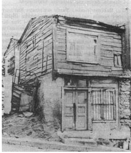
Bediüzzaman Hazretlerinin 1953'ün Nisan sonundan, Ağustos başına kadar üç ay kadar kaldığı ev.