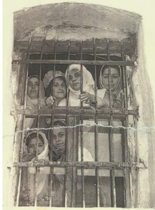
Hakkında onlarca dava açılan Şule Yüksel Şenler 1971 yılında 9 ay 10 gün Bursa Cezaevinde hapis yatmıştı

Üstad'a gittiğimde bana: "Kardeşim sen evde annene babana karşı yumuşak davran... Onlar bilmiyorlar... Sen onlara çok yumuşak davran... Gönüllerini almaya bak ve sık sık ziyaretlerin git..." derdi. Doğrusu ben çok sık gidemedim evime. Seyrek gidebiliyordum. Üstad Hazretleri babamın bana karşı olduğunu biliyordu. "Bîçare bilmiyor" derdi babama. Ama "Ziya'nın babası gibi değil" derdi. Ziya'nın babası çok muhalifti. Bu şekilde on sene devam etti.