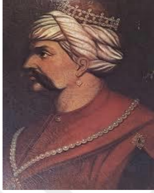
YAVUZ SULTAN SELİM