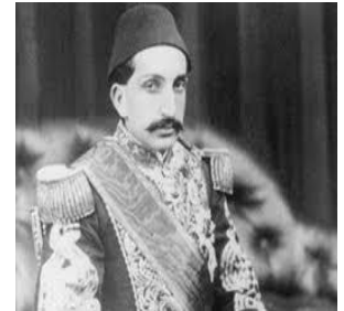
Sultan II. Abdlhamid Han