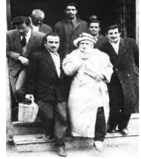
1959 Senesi Ankara