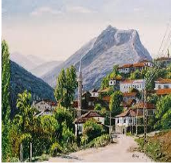
Barla Ky (Isparta)