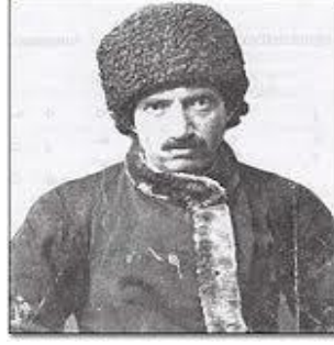
Rusya'daki Esaretinden İstanbul'a Dnerken Alman Makamları Tarafından Çekilen Fotođrafı