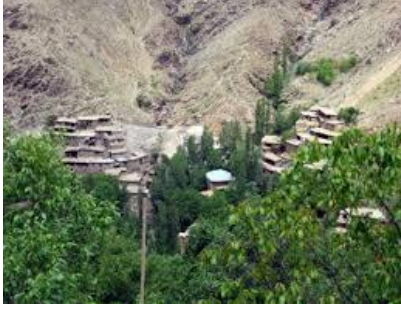
Dođduđu Nurs Ky (Bitlis)