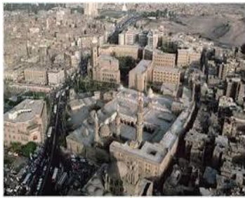
El-Ezher niversitesi (Mısır)