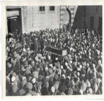
Cenaze Merasimi (Şanlıurfa)