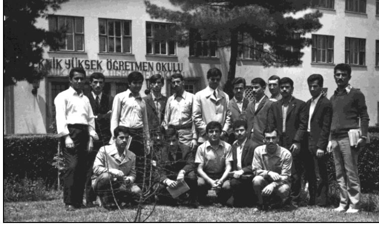
1972'de Ankara Erkek Teknik Yüksek Öğretmen Okulu'nun (Teknik İlahiyat) ilk Nur Talebelerinden bir grup